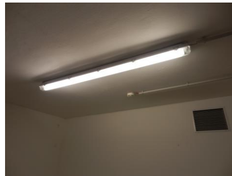
Abbildung 4: Beleuchtung