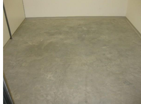
Abbildung 2: Boden