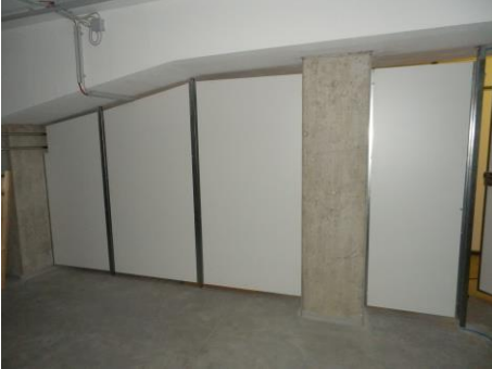
Abbildung 1: Trennwände