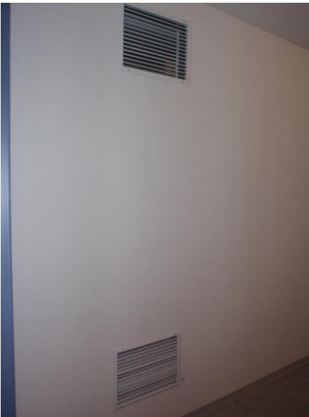
Abbildung 3: Klimatisierung